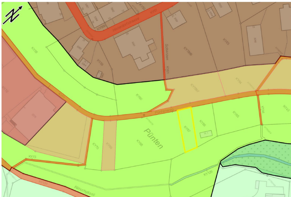
Auszug GIS mit Zonierung und Grundeigentum der Stadt Illnau-Effretikon

Der Eigentümer der Liegenschaften Kat.Nrn. KY526, KY15 und KY67, Kyburg, verkauft gemäss öffentlich beurkundetem Kaufvertrag vom 6. Mai 2021 seine Liegenschaften. Das Grundstück Kat.Nr. KY67 mit einer Fläche von 232 m 2 liegt in der kantonalen Freihaltezone.