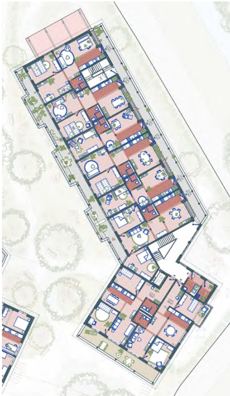
2. + 3. Obergeschoss

Beim Bestandesbau ist nur die strassenseitige Südwestfassade im Erdgeschoss von Überschreitungen betroffen. Im Erdgeschoss befindet sich ein grosser offener Wohn-/Essbereich, welcher über Lüftungsfenster an der Seiten- und Rückfassade lärmabgewandt belüftet werden kann. Die Überschreitung der Grenzwerte betragen bis zu 1.3dB am Tag und bis zu 1.4dB in der Nacht. Das Wohn-/Esszimmer ist der einzige Raum im bestehenden Bauernhaus, welcher von Überschreitungen betroffen ist.