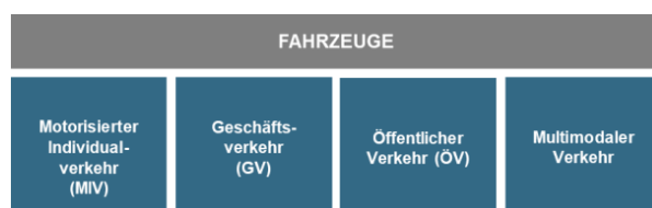
Abbildung 2: Die vier Handlungsfelder mit Bezug auf die Elektrifizierung von Fahrzeugen, Quelle: [12]

Mit dem Konzept Elektromobilität und alternative Antriebssysteme vom 21. Februar 2020 wurde ein Zukunftsbild, Handlungsfelder und konkrete Massnahmen für die Stadt Illnau-Effretikon aufgezeigt, um die Chancen der Elektromobilität zu verwirklichen und die Risiken zu vermeiden oder mindestens zu minimieren. Die Stadt Illnau-Effretikon kann mit einem öffentlich zugänglichen Ladestellennetz und gezielten Massnahmen die Elektromobilität gezielt fördern. Der Handlungsbedarf im Bereich Verkehr ist zwar sehr gross, allerdings ist der Handlungsspielraum auf Ebene Gemeinde beschränkt. Zur gezielten Förderung der Elektromobilität eröffnen sich für die Stadt Illnau-Effretikon acht Handlungsfelder. Einerseits gibt es vier Handlungsfelder auf Ebene der Fahrzeuge. Andererseits gibt es vier Handlungsfelder, welche die Energieversorgung der Mobilität und deren Integration ins Stromsystem betrachten.