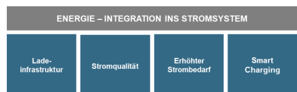
Abbildung 3: Die vier Handlungsfelder mit Bezug auf die Energieversorgung der Elektromobilität, Quelle: [12]