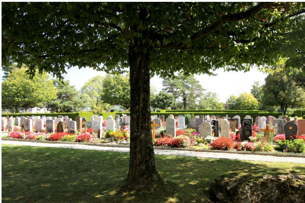
Friedhof Zelgli, Effretikon